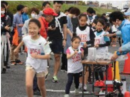
こども1kmスタート風景