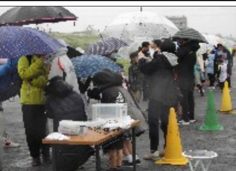
月例川崎マラソン実行委員会