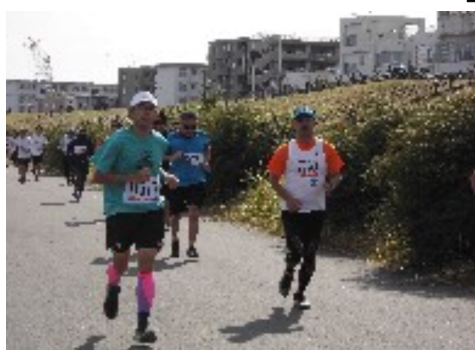
月例川崎マラソン実行委員会