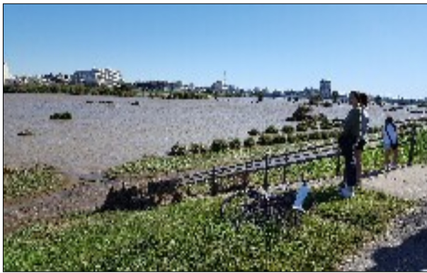
月例マラソンの会場