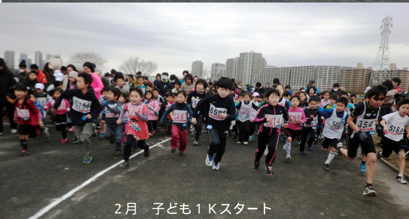
2月 子ども1Kスタート