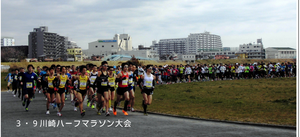
3・9川崎ハーフマラソン大会