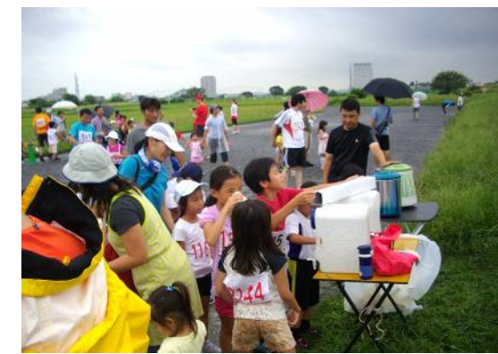
8月月例 子ども1kmの部 元気に飛び出す幼少の皆さん。

第450回月例川崎マラソンでは子ども1km が始まる頃の湿度も高く、WBG温度が26度を 示しましたが10*は5*へ短縮する可能性の放送 をしました。10時の時点でWBG温度が24度 に下がりましたので10*として実施しました。 10*出場者から、突然10*へ戻されても準備 が出来ない等の意見が寄せられました。 よって 実行委員会検討し「その日のWBG T温度での距離の短縮の判断」は「出発時間 の30分前で判断する」ことに変更します。